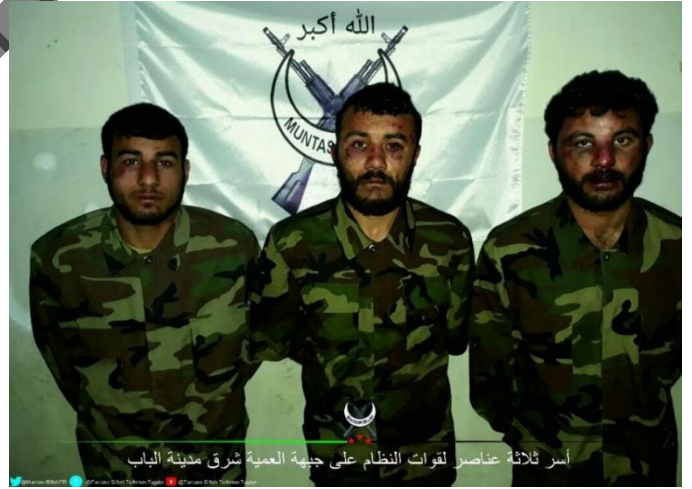
أسر ثلاثة عناصر لقوات النظام على جبهة العمية شرق مدينة الباب

ريف حلب الشرقي: درع الفرات تأسر 3 جنود من ميليشيات الأسد تتكرر عملية الاسر على هذا المحور مما يطرح فكرة فتح طريق لتسهيل انشقاق الجنود الذين لا يريدون القتال في صفوف الميليشيات