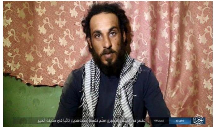
عنصر من جنود النصيري سلم نفسه للجهاديين تاليا في مدينة الخير

دير الزور: انشقاق جندي من ميليشيات الأسد وقام بتسليم نفسه لتنظيم الدولة