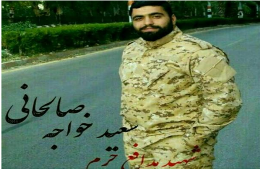
صالحاني سعد حواج مستد دفاع ترم

هالك قائد ميداني إيراني في سوريا يدعى سعيد صالحاني